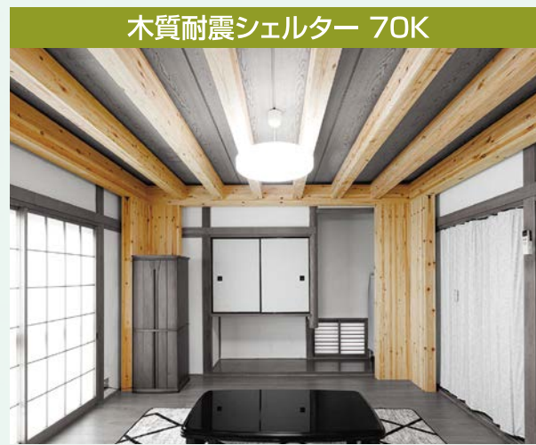
木質耐震シェルター 70K