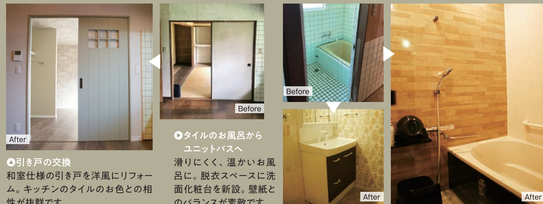
●引き戸の交換 和室仕様の引き戸を洋風にリフォーム。キッチンのタイルのお色との相性が抜群です。